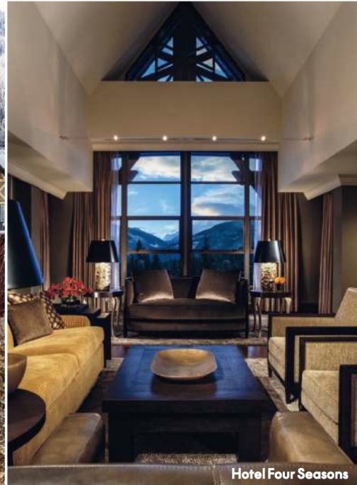
Hotel Four Seasons